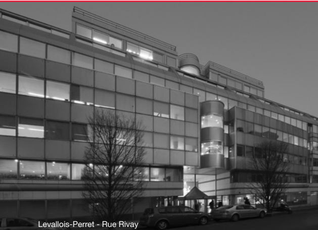
Levallois-Perret - Rue Rivay