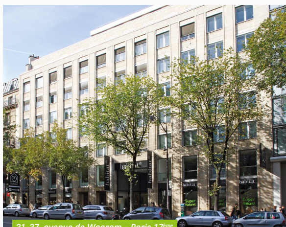
31-37, avenue de Wagram - Paris 17 ème

Au cours du premier trimestre 2020, EDF a libéré le sixième étage, d'une surface d'environ 1 300 m 2 , de l'immeuble situé avenue de Wagram, à Paris 17 ème . Quelques jours après, un nouveau bail a pris effet. Le locataire est une entreprise innovante qui propose une solution digitale pour les services de santé.