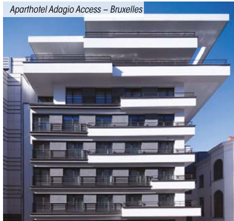
Aparthotel Adagio Access – Bruxelles

*** Pour les non résidents seuls les immeubles détenus en France sont pris en compte.