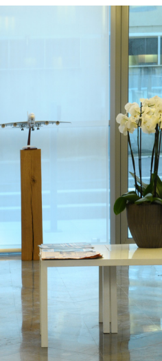
NANTERRE (92) ZAC des Groupes