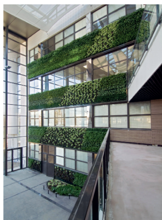
CLAMART (92) - «Le Panoramic»

PFO 2 n'a jamais aussi bien porté son nom : suite à une démarche initiée l'année dernière, PERIAL Asset Management a obtenu au mois de juin 2016 la certification ISO 50001 pour sa SCPI « verte ».