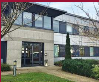
Parc Européen de l'Entreprise à Strasbourg Schiltigheim