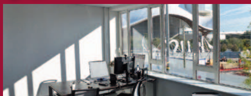
Nouveau quartier de l'Amphithéâtre à Metz

Zoom sur... une diversité d'immeubles de bureaux