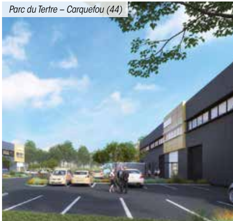
Parc du Terre - Carquefou (44)

*** Pour les non résidents seuls les immeubles détenus en France sont pris en compte.