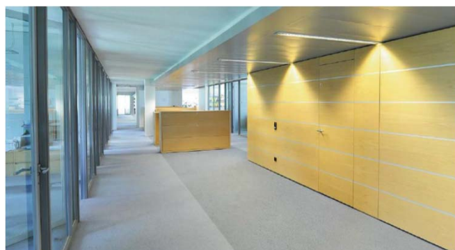
Laimer Atrium Munich